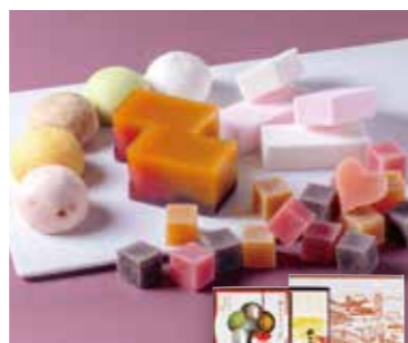
YS-96〈風流堂〉 風流菓子詰合せ 5,483円(本体5,076円) 277118 送料込 日の出(200g×2)×1、五線の味わいひとくち饅頭5個入 ×1、山川古今4本入×1、遊びかん80g×1 賞味期限:常温で11日