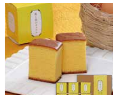
YS-97〈風流堂〉 風と森のカステラ 5,433円(本体5,030円) 277126 送料込 風と森のカステラ×9 賞味期限:常温で21日