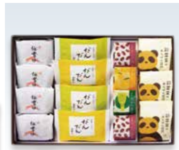
YS-99〈彩雲堂〉 松かさね 3,618円(本体3,350円) 276200 あんぱん饅頭×3、彩雲ようかん(小倉)×2、彩雲ようかん(抹茶・柚子)×各1、伯耆坊×4、だんだん(抹茶・チョコ)×各2 賞味期限:常温で15日