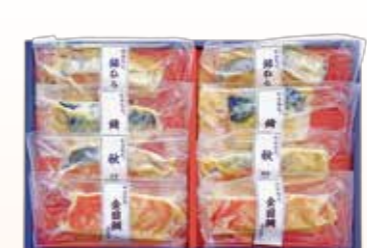
YS-2〈山陰大松〉 氷温熟成 味わい西京漬けギフト8切 4,320円(本体4,000円) (SSK-40T) 276499 冷凍便 金目鯛西京漬け60g・秋鮭西京漬け60g・銀ひらす西 京漬け60g・さば西京漬け70g 各2 賞味期限:冷凍で60日