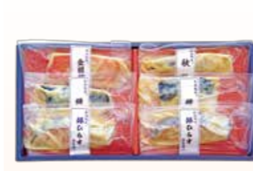
YS-1〈山陰大松〉 氷温熟成 味わい西京漬けギフト6切 3,240円(本体3,000円) (SSK-30T) 276464 冷凍便 金目鯛西京漬け60g×1、銀ひらす西京漬け60g×2、 さば西京漬け70g×2、秋鮭西京漬け60g×1 賞味期限:冷凍で60日

11月6日(水)→12月25日(水) 4階 ばらのギフトセンター ■ギフトサロン松江 (ギフトサロン松江は 11月7日(木)→12月24日(火) (毎週水曜日は定休日))