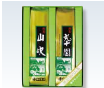
YS-90〈中村茶舗〉 銘茶詰合せ 3,057円(本体2,830円) (BF-283) 277096 丸十圓80g×1、山吹80g×1