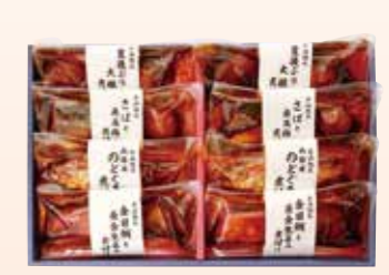
YS-8〈山陰大松〉 氷温熟成 お魚物野菜ギフトセット(和の心) 5,400円(本体5,000円) (OG-50T) 276847 冷凍便 金目鯛と黄金生姜の煮付け100g・さばと南高梅の煮付け 110g・豊後ぶりと大根の煮付け120g・山陰産のどぐるの 煮付け85g 各2 賞味期限:冷凍で60日

※一部の商品を除き、配達で承らせていただきます。※品数に限りのある商品もございますので売切れの際はご容赦ください。 ※商品の品質上、抱き合わせ配送のできない商品がございます。※割引は対象外とさせていただきます。 ※消費または、賞味期限は、製造・加工日を基準に記載いたしております。※商品到着後の日持ち期限は、配達日数などにより異なります。なお、表記のされていない商品 (一部生鮮品を除く)の賞味期限は、31日以上でございます。※生鮮品(農水畜産物)及び、それらを原材料とした加工品につきましては、一部重量表記をしております。 原料が自然のもので、実際の大きさや形状、個数が異なる場合がございますが、内容量に変わりはありません。 ※水産物は漁獲状況により、原産地が変わる場合がございます。 ※農産物につきましては、産地の収穫状況、天候等によりお届けが前後する場合がございます。また、産地・農園の収穫状況により、他の産地・農園に変更させていただく 場合がございます。※写真の一部は調理・盛り付けなどの見本例です。器類は商品に含まれておりません。 ※価格は消費税を含む総額にて表示しております。 ※送料込み商品、 冷蔵便 マーク商品、 冷凍便 マーク商品は、仏事包装等承ることができない包装・進物体裁がございます。 冷蔵便 送料込 冷蔵便 マーク商品は、クール便でお届けします。 冷凍便 送料込 冷凍便 マーク商品は、冷凍クール便でお届けします。