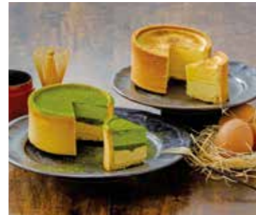
YS-92〈KANOZA IZUMO〉 抹茶フォンデュ・フロマージュフォンデュセット 4,700円(本体4,351円) 276413 冷凍便 抹茶フォンデュ・フロマージュフォンデュ 各1