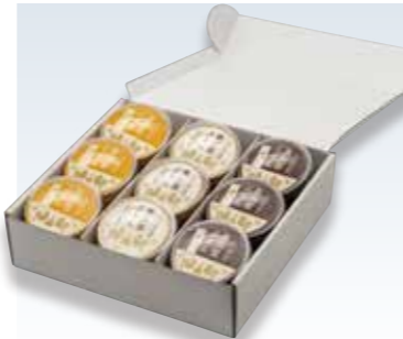
YS-93〈奥出雲前綿屋〉 奥出雲ぶりん3種セット9個入 3,401円(本体3,149円) 276715 奥出雲ぶりん94g×3、奥出雲ぶりん(チョコ)96g×3、 奥出雲ぶりん(はちみつ)91g×3