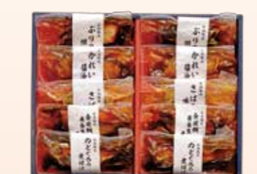
YS-6〈山陰大松〉 氷温熟成 ふっくら煮魚・焼魚ギフト10切 5,400円(本体5,000円) (TK-100) 276510 冷凍便 のどぐるの煮付け85g・金目鯛と黄金生姜の煮付け100g・ かれい・醤油煮100g・ぶりの照り焼き90g・さばの味噌煮90g 各2 高島屋限定 賞味期限:冷凍で60日