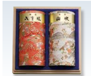
YS-91〈中村茶舗〉 銘茶詰合せ 5,400円(本体5,000円) (N2-50) 277100 山吹120g×1、八重垣120g×1