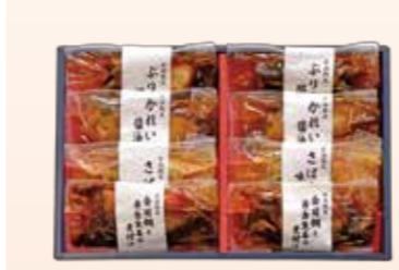
YS-5〈山陰大松〉 氷温熟成 ふっくら煮魚・焼魚ギフト8切 4,320円(本体4,000円) (TK-40) 276502 冷凍便 金目鯛と黄金生姜の煮付け100g×2、かれい・醤油煮 100g×2、プリの照り焼き90g×2、さばの味噌煮90g×2 高島屋限定 賞味期限:冷凍で60日