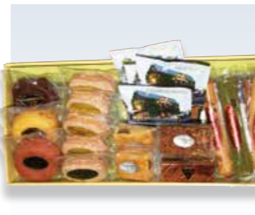
YS-101〈ウイーンの森〉 焼き菓子詰合せ 5,361円(本体4,963円) 276111 ドーナツ(プレーン・ショコラ・いちご)各1、 ダックワーズ×5、サブレボンム×2、 キャラルサス・エンガディーヌ各1、 ウインナーシュバイゼ(5種 各1)、ドリップコーヒー(2種 各2) 賞味期限:常温で10日