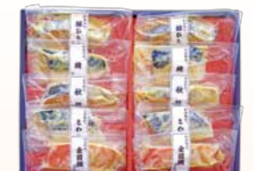
YS-3〈山陰大松〉 氷温熟成 味わい西京漬けギフト10切 5,400円(本体5,000円) (SSK-50T) 276472 冷凍便 金目鯛と西京漬け60g×2、秋鮭西京漬け60g×2、 銀ひらす西京漬け60g×2、さば西京漬け70g×2、 鱈西京漬け60g×2 賞味期限:冷凍で60日