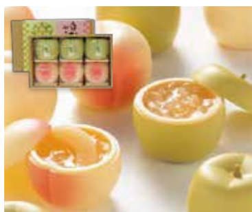
YS-95〈寿製菓〉 二十世紀梨ゼリー感動です。 &白桃ゼリー詰合せ 4,536円(本体4,200円) (NM-6) 276375 二十世紀梨ゼリー感動です・白桃デザート 各3