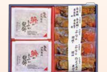
YS-7〈山陰大松〉 氷温熟成 味わい魚物野菜セット 4,320円(本体4,000円) (KOS-40T) 276529 冷凍便 金目鯛と黄金生姜の煮付け100g×2、のどぐるの煮付け 85g×1、ぶりの照り焼き90g×2、鱈の甘酢漬150g×2 賞味期限:冷凍で60日