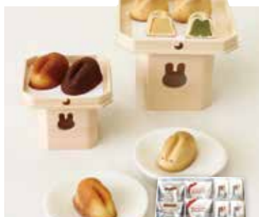
YS-94〈寿製菓〉 福を呼び縁を結ぶ うさぎスイーツアソート 3,240円(本体3,000円) (USA) 276219 因幡のうさぎ・因幡のうさぎ抹茶餡・白うさぎフィナン シエ・白うさぎフィナンシェプレミアムショコラ 各4 賞味期限:常温で30日