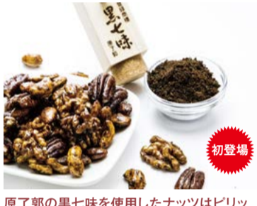
原了郭の黒七味を使用したナッツはピリツ とした唐辛子の辛さ、山椒の豊かな香り で日本唐辛子によく合います。 【COCOLO KYOTO】 京都府京都市 祇園黒七味ナッツ(大) (65g) ..... 1,501円