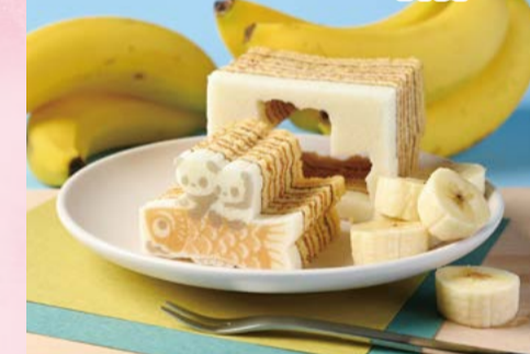
かわいい子どもパンダが主役の型ぬき パウムです。りっぱな鯉のぼりに乗って 大空を泳ぐ、バナナ味のパウムです。 【カタヌキヤ】 東京都中央区 こいのぼりパンダ パウム(1個) ..... 540円