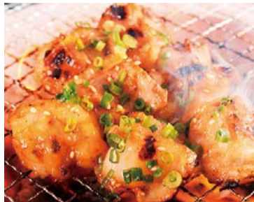
【もつ鍋ホルモン焼き 黄金屋】 東京都渋谷区 味付け国産牛ホルモン各種 (マルチョウ・シマチョウ・ミノサンド・ギアラ) (各240g) ..... 1,651円