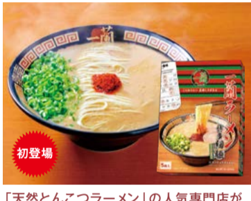
「天然とんこつラーメン」の人気専門店が 自信を持ってお届けするこだわりの細麺と、 とんこつ本来の深いコクと旨味をぜひ ご家庭でご賞味ください。 【一蘭】 福岡県福岡市 一蘭ラーメン (博多細麺ストレート5食) ..... 2,301円