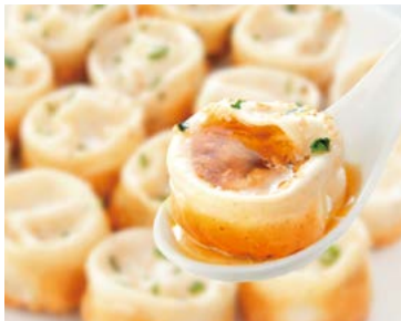
もちもちカリカリの皮からあふれ出す 肉汁コラーゲンが絶品 【王府井(ワンフーチン)】 神奈川県横浜市 正宗生煎包(焼き小籠包) (8個入/1パック) ..... 1,350円