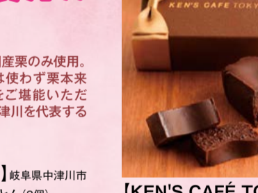
常温ではテリテリヌシヨコラ、冷やすと 生チョコ感覚、レンジで軽く温めると フォンダンシヨコラのように、温度に よって変化する様々な食感と口溶けを お楽しみください。 【KEN'S CAFÉ TOKYO】 東京都新宿区 特撰トーストシヨコラ(1本) ..... 4,000円