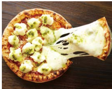
シューイチ全国うまいもの博限定商品です。 イタリア産モッツァレラが通常の5倍たっぷり! 【うちピザ ピッコロツ】 兵庫県姫路市 ピッコロツの5倍マルゲリータ (1枚/直径約20cm) ..... 2,322円