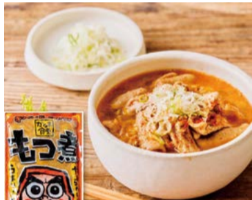
【だるま食堂】 群馬県高崎市 だるま食堂のもつ煮 (400g) ..... 1,350円