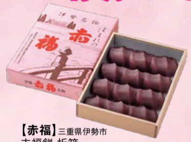
【赤福】 三重県伊勢市 赤福餅 折箱 (12個入) ..... 1,300円