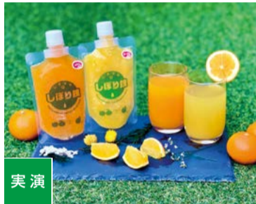
【島の駅まなみ】 広島県尾道市 ①そのまんま100%みかん冷凍ジュース (200g) ..... 540円 ②そのまんま100%みかんジュース (250ml) ..... 540円