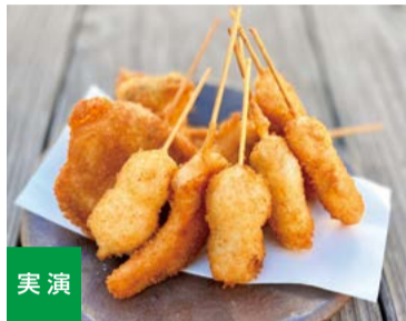
クロワッサン生地で巻いて揚げた串カツは 冷めても美味しいのが特徴です 【くよし本店】 大阪府大阪市 おまかせ10本セット (10本入) ..... 1,680円