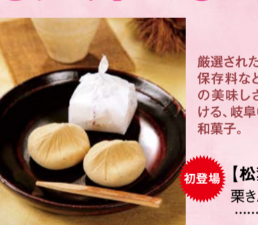
厳選された国産粟のみ使用。 保存料などは使わず粟本来 の美味しさを堪能いただける、 岐阜中津川を代表する 和菓子。 【松葉】 岐阜県中津川市 栗きんとん(3個) ..... 1,001円