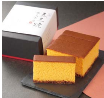
【菓秀苑森長】 長崎県諫早市 五三焼きカステラ (5枚入/260g) ..... 1,836円

■4月29日(水・祝)~5月7日(木) ※最終日5月7日(木)は午後3時閉場 ■4階 催場 / 1階 特設会場 / <イートイン>5階 特設会場 ※各種ポイントカードのポイントサービス、ならびに各種ご優待は対象外とさせていただきます。ただし、タカシマヤのクレジットカード決済のポイントサービスは対象です。※出店内容・出店店舗等変更になる場合がございます。