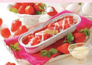
濃厚で滑らかなアイスプリンの上に 苺ピューレ&苺果実&濃厚ミルクソ ースをトッピング。爽やか苺と濃厚 ミルクソースの美味しさをお楽しみ 下さい。 【みれい菓】 北海道札幌市 札幌カタラーナ いちごみるく (1個) ..... 1,620円