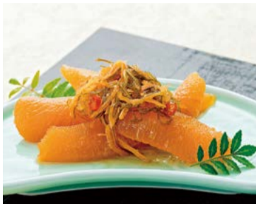
【竹田食品】 北海道函館市 北海道産数の子入り松前漬 (100gあたり) ..... 1,296円