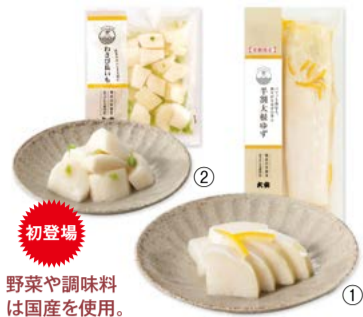
【京つけもの 大安】 京都府京都市 ①半割大根ゆず(1本) ..... 756円 ②わさび長いも(100g) ..... 594円