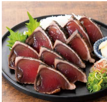
【高知の魚家さん】 高知県高知市 薫焼きかつおたたき (100gあたり) ..... 1,350円