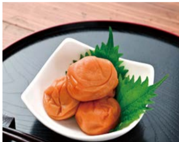
【紀州南高梅 丸福本舗】 和歌山県田辺市 紀州の梅 はちみつ (550g) ..... 3,801円