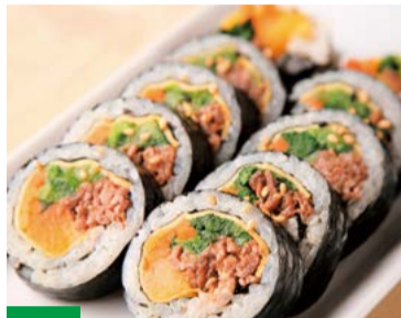
【韓国家庭料理でりかおんどの】 東京都新宿区 プルコギキンパ(1パック) ..... 1,296円