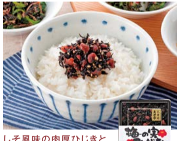
しそ風味の肉厚ひじきと 歯ごたえのよい梅の実の 食感が爽やかな逸品。 【太宰府えとや】 福岡県太宰府市 梅の実ひじき(150g) ..... 864円