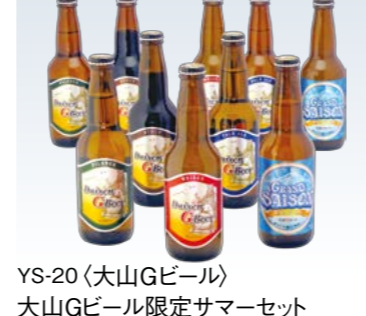
YS-20〈大山Gビール〉 大山Gビール限定サマーセット 5,830円 (本体5,300円) (GB-S10) 174068 冷蔵便 ピルスナー・ヴァイツェン・ペールエール・スタウト・ グランゼン(夏限定ビール)各330ml×2 高島屋限定