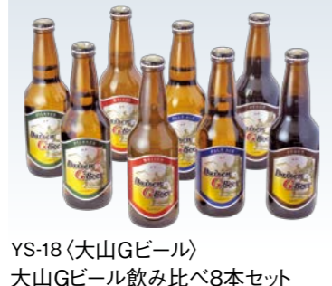
YS-18〈大山Gビール〉 大山Gビール飲み比べ8本セット 4,400円 (本体4,000円) (GB-8) 174017 冷蔵便 ピルスナー330ml×2、ペールエール330ml×2、 ヴァイツェン330ml×2、スタウト330ml×2