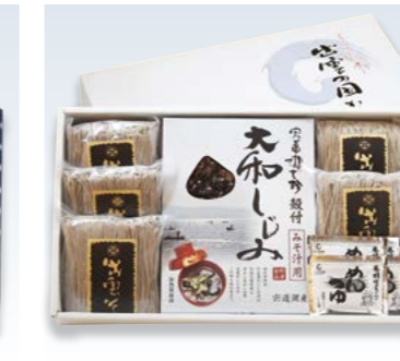
YS-78 (児玉製麺) 出雲の国から 4,860円 (本体4,500円) (OR-4R) 174181 出雲半なまそば200g×5、 光枝はあちゃんのめんつゆ (濃縮) 35g×5、 宍道湖産殻付しじみ100g×3