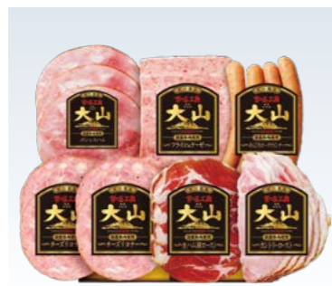
YS-10〈大山ハム〉 食の匠工房6種7品詰合せ 4,320円 (本体4,000円) (TK-40Y) 174300 冷蔵便 ボンレスハム78g・フライシュケーゼ80g・あらびきポーク ウインナー120g・生ハム(肩ロース)40g・カントリーロ ースト72g 各1、チーズリヨナー36g×2 賞味期限:冷蔵で30日