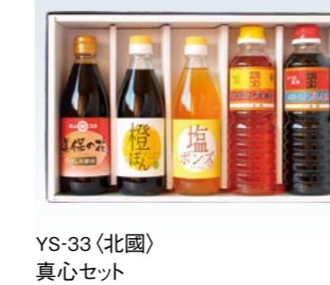
YS-33〈北國〉 真心セット 4,104円 (本体3,800円) (E-5-5) 174513 美保の花・橙ぼん・塩ポンス各360ml×各1、 だし醤油(うすくち・こいくち)各500ml×各1