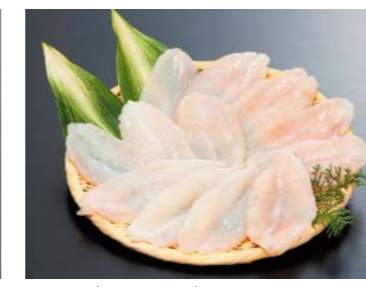
YS-67 (和田珍味) ふぐ一夜干 5,400円 (本体5,000円) (U50) 174637 冷凍便 ふぐ一夜干520g 賞味期限:冷凍で365日