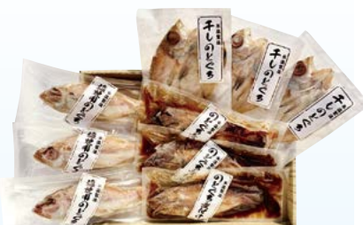
YS-4 〈山陰大松〉 のどぐろ三味詰合せ 5,400円 (本体5,000円) 〈NSM-50〉 174548 冷凍便

ぶり西京漬け70g・銀鮭西京漬け60g・ 銀ひらす西京漬け60g・さば西京漬け60g・ 鯖西京漬け70g 各2 賞味期限:冷凍で60日