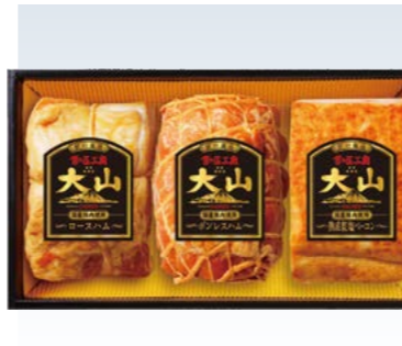
YS-16〈大山ハム〉 食の匠工房3種詰合せ 8,640円 (本体8,000円) (CN-17) 174343 冷蔵便 ボンレスハム360g・ロースハム360g・ 熟成乾塩ベーコン250g 各1 賞味期限:冷蔵で30日