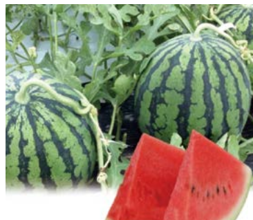
YS-99 <大山町 原農園> 鳥取県産大玉スイカ 羅皇(らおう) 7,500円 (本体6,944円) (R-1) 174092 9kg以上×1 お届け時期:7月上旬から中旬 ※配達日指定不可