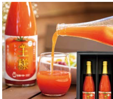
YS-100 <日南トマト加工> 夏の極み 王様トマトジュース 2本セット 6,701円 (本体6,204円) (NT-材ヲ2) 174165 送料込 王様トマトジュース720ml×2

※一部の商品を除き、配達で承らせていただきます。※品数に限りのある商品もございますので売切れの節はご容赦ください。 ※商品の品質上、抱き合わせ配送のできない商品がございます。※割引は対象外とさせていただきます。 ※消費または、賞味期限は、製造・加工日を基準に記載いたしております。※商品到着後の日持ち期限は、配送日数などにより異なります。なお、表記のされていない商品(一部生鮮品を除く)の賞味期限は、31日以上でございます。※生鮮品(農水畜産物)及び、それらを原材料とした加工品につきましては、一部重量表記をしております。原料が自然のもので、実際の大きさや形状、個数が異なる場合がございますが、内容量に変わりはありません。 ※水産物は漁獲状況により、原産地が変わる場合がございます。 ※農産物につきましては、産地の収穫状況、天候等によりお届けが前後する場合がございます。また、産地・農園の収穫状況により、他の産地・農園に変更させていただきます場合がございます。※写真の一部は調理・盛り付けなどの見本例です。器類は商品に含まれておりません。 ※価格は消費税を含む総額にて表示しております。 ※送料込み商品、 冷蔵便 マーク商品、 冷凍便 マーク商品は、仏事包装等承ることができない包装・進物体裁がございます。