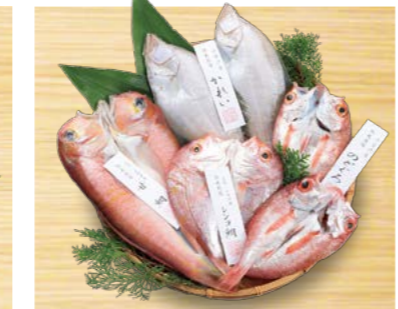
YS-72 (小伊津海旬房) 海旬房セット さやか 7,020円 (本体6,500円) (KSサカ) 174874 送料込 冷凍便 甘鯛約200g×1、エテカレイ約110g×2、レンコ鯛約120g×1、 のどぐろ約80g×2 賞味期限:冷凍で60日