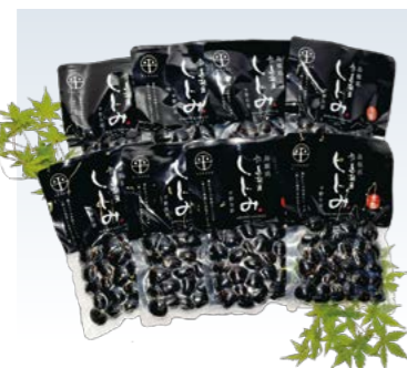
YS-58 (平野缶詰) 宍道湖産大和しじみ大粒 5,300円 (本体4,907円) (HK-53) 174858 送料込 宍道湖産レトルトしじみ大粒 (L) 140g×8