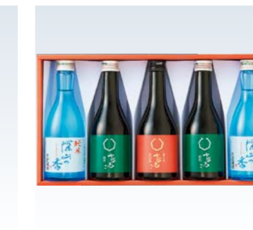
YS-75 (籾上清酒) 七冠馬・深山の香 純米 味わいセット 4,251円 (本体3,864円) (57) 174467 七冠馬純米吟醸一番人気300ml×1、 七冠馬純米・深山の香純米生貯蔵 各300ml×各2