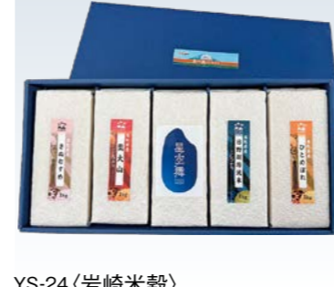
YS-24〈岩崎米穀〉 大山山麓米食べ比べセット 8,100円 (本体7,500円) 174785 星空舞・日野川源流こしひかり・奥大山こしひかり・きぬ むすめ・ひとぼけ 各1kg