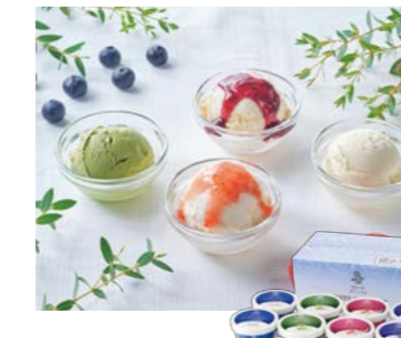
YS-85 (大山乳業) 白バラプレミアムアイスギフト8個 4,700円 (本体4,351円) (シハラプレミアム7A8) 174610 送料込 冷凍便 白バラプレミアムアイス (ミルク・抹茶) 各110ml×各2、 いちご・ブルーベリー&クリームチーズ) 各95ml×各2