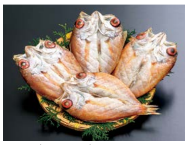
YS-65 (和田珍味) のどぐろ一夜干 5,400円 (本体5,000円) (N-50) 174912 冷凍便 のどぐろ一夜干×4 賞味期限:冷凍で365日