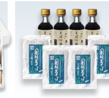
YS-79 (奥出雲そば処 一福) 奥出雲八割純生そば (8人前) 4,320円 (本体4,000円) (IF-8) 174203 冷凍便 八割純生そば240g×4、そばつゆ150ml×4 ※6月20日からのお届け 賞味期限:冷蔵で30日