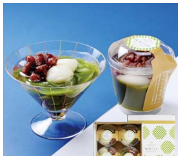
YS-94 <風流堂> 抹茶ジュレ6個入 5,627円 (本体5,210円) 174157 送料込 冷蔵便 抹茶ジュレ160g×6 賞味期限:冷凍で31日