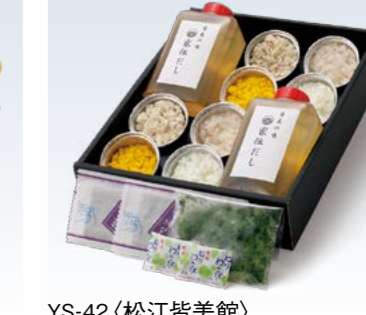
YS-42〈松江皆美館〉 皆美家伝鯛めし2人前セット 5,940円 (本体5,500円) (MN-TM02) 174475 送料込 冷蔵便 鯛めしの具(鯛、白身、黄身、大根おろし、わさび、海 苔、乾燥ねぎ)各2、家伝だし(200ml)×2 賞味期限:冷凍で90日