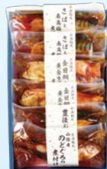
YS-7 〈山陰大松〉 水温熟成 お魚惣菜ギフトセット(和の心)4種6切 5,400円 (本体5,000円) 〈OG-50ST〉 174831 冷凍便

ぶりの照焼き90g・さばの味噌煮90g・かれい醤油煮100g・ めぬけと黄金生姜の煮付け100g・のどぐろ煮付け85g 各2 高島屋限定 賞味期限:冷凍で60日