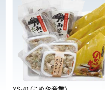
YS-41〈こめや産業〉 山陰ふるさと 味わいセット 5,850円 (本体5,416円) (KM-1) 174726 冷凍便 ののこめし180g×4、大山おこわ150g×4、大山山いも そば250g×3 賞味期限:冷凍で60日