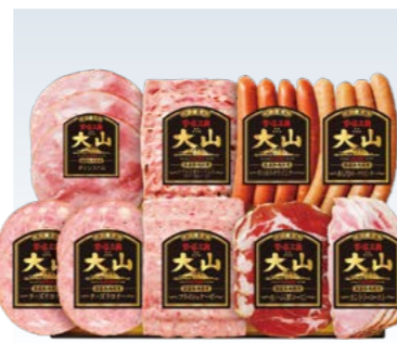
YS-11〈大山ハム〉 食の匠工房8種9品詰合せ 5,400円 (本体5,000円) (TK-50Y) 174319 冷蔵便 ボンレスハム78g・フライシュケーゼ80g・あらびきポーク ウインナー120g・辛口ポチキウインナー120g・生ハム (肩ロース)40g・カントリーロースト72g・トマトとオリブ 入りソーセージ100g 各1、チーズリヨナー36g×2 賞味期限:冷蔵で30日