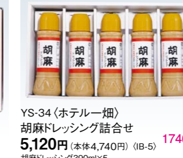
YS-34〈ホテル一畑〉 胡麻ドレッシング詰合せ 5,120円 (本体4,740円) (IB-5) 174688 胡麻ドレッシング390ml×5