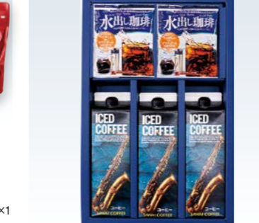
YS-39〈奥大山の水洗い珈琲〉 水洗い珈琲飲み比べ(粉) 4,700円 (本体4,351円) (OKU-K4) 174890 プナの森(中煎り・粉)180g×1、深い森(深煎り・粉)155g×1