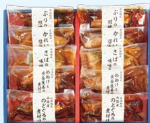
YS-6 〈山陰大松〉 水温熟成 ふっくら煮魚焼魚ギフト10切 5,400円 (本体5,000円) 〈TK-100〉 174572 冷凍便

ぶりの照焼き90g・さばの味噌煮90g・かれい醤油煮 100g・めぬけと黄金生姜の煮付け100g 各2 高島屋限定 賞味期限:冷凍で60日