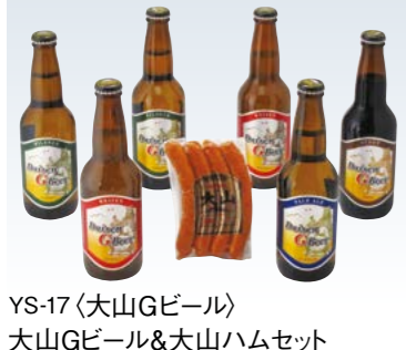
YS-17〈大山Gビール〉 大山Gビール&大山ハムセット 4,070円 (本体3,700円) (GH-C) 174041 冷蔵便 ピルスナー・ヴァイツェン各330ml×2、ペールエール・スタ ウト各330ml×1、パーベキューソーセージ120g×1 賞味期限:冷蔵で40日