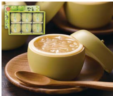
YS-89 <寿製菓> 二十世紀梨ゼリー感動です。 4,701円 (本体4,352円) (N-6) 174025 二十世紀梨ゼリー感動です。×6