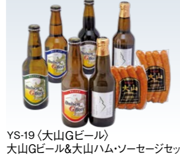
YS-19〈大山Gビール〉 大山Gビール&大山ハム・ソーセージセット 5,500円 (本体5,000円) (BBS-50N) 174114 冷蔵便 ピルスナー・ペールエール・ヴァイツェン・スタウト各330 ml×1、パーレワイン330ml×2、辛口ポチキウインナー 120g・あらびきポークウインナー120g 各1 高島屋限定 賞味期限:冷蔵で40日