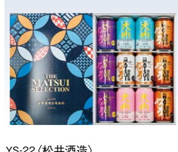
YS-22〈松井酒造〉 ビール・ハイボールセット 3,960円 (本体3,600円) (マツビル&HB) 175005 MATSUビールハイクラス・ビール熟成 各350ml× 各3、ビールライト 350ml×2、大山ミズナラハイボ ール・サクラハイボール 各350ml×各2