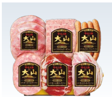
YS-9〈大山ハム〉 食の匠工房6種詰合せ 3,240円 (本体3,000円) (TK-30Y) 174297 冷蔵便 ボンレスハム78g・フライシュケーゼ80g・ あらびきポークウインナー120g・生ハム(肩ロース)40g・ カントリーロースト72g 各1、チーズリヨナー36g×1 賞味期限:冷蔵で30日