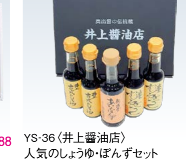
YS-36〈井上醤油店〉 人気のしょうゆ・ぼんずセット 3,456円 (本体3,200円) (SP-35) 174262 古式しょうゆ・出雲むらさき 各150ml×各2、 あいのぼんず200ml×1