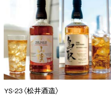
YS-23〈松井酒造〉 マツイウイスキー 「鳥取」「山陰」2本セット 5,357円 (本体4,870円) (マツイトリ&サン) 174998 マツインテッドウイスキー「鳥取金ラベル」・ 「山陰パーパレル」各700ml×各1