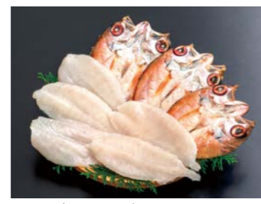
YS-66 (和田珍味) ふぐのどぐろ一夜干 5,400円 (本体5,000円) (UN-50) 174629 冷凍便 ふぐ一夜干210g、のどぐろ一夜干×3 賞味期限:冷凍で365日