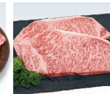
YS-27〈新日本食品〉 しまね和牛ロースステーキ 10,800円 (本体10,000円) (SN-100) 174459 送料込 冷凍便 200g×2 賞味期限:冷凍で30日