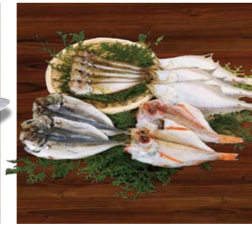
YS-63 (中浦食品) 鶴鶴屋 一夜干詰合せA 5,940円 (本体5,500円) (L1-1) 174505 冷凍便 えてカレイ3枚、あじ開き2枚、はたはた5尾、 のどぐろ開き2枚 賞味期限:冷凍で30日