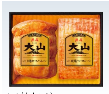
YS-13〈大山ハム〉 伝統の逸品 2種詰合せ 3,780円 (本体3,500円) (OR-24) 174360 冷蔵便 熟成糸巻ロースハム320g・熟成乾塩ベーコン180g 各1 賞味期限:冷蔵で45日