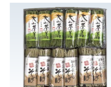
YS-81 (長田茶店) 山陰麺詰合せ 3,780円 (本体3,500円) (MC-35) 174602 大山茶そば80g×6、砂丘長いもそば80g×6、 めんつゆ21ml×12