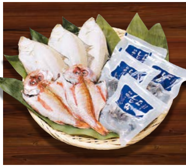
YS-61 (中浦食品) 鶴鶴屋 一夜干としじみ詰合せA 5,184円 (本体4,800円) (L1-13) 174416 冷凍便 えてカレイ3枚、のどぐろ2枚、冷凍大和しじみ (宍道湖産) 60g×4 賞味期限:冷凍で30日