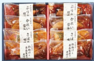
YS-5 〈山陰大松〉 水温熟成 ふっくら煮魚・焼魚ギフト8切 4,320円 (本体4,000円) 〈TK-40〉 174564 冷凍便

干しのどぐろ50g・のどぐろ煮付け85g・ 塩焼用のどぐろ50g 各3 高島屋限定 賞味期限:冷凍で60日