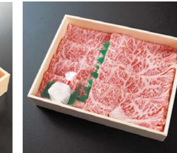
YS-32〈肉匠はなふさ〉 鳥取和牛肩ローススライス冷凍 10,000円 (本体9,259円) (T-5) 174386 送料込 冷凍便 500g 賞味期限:冷凍で90日