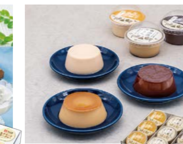
YS-83 <たなべたたらの里> 奥出雲ぶりん3種セット9個入 3,601円 (本体3,334円) 174823 奥出雲ぶりん94g×3、奥出雲ぶりん (チョコ) 96g×3、 奥出雲ぶりん (はちみつ) 91g×3