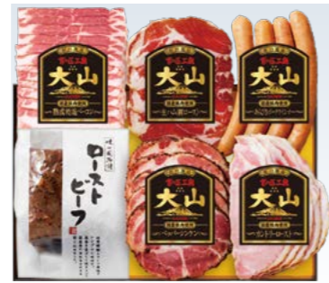
YS-15〈大山ハム〉 食の匠工房6種詰合せ 6,480円 (本体6,000円) (CN-27) 174335 冷蔵便 熟成乾塩ベーコン80g・ペッパーシンケン72g・ カントリーロースト72g・生ハム(肩ロース)40g・ロース トビーフ200g・あらびきポークウインナー120g 各1 賞味期限:冷蔵で30日