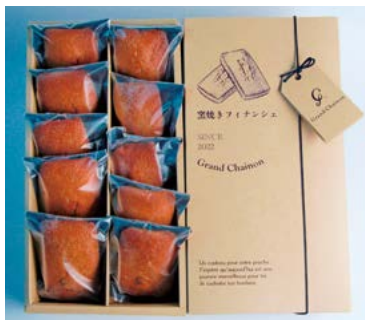
YS-93 <グランシェノン> 窯焼きフィナンシェ10個入 3,305円 (本体3,060円) 174980 冷蔵便 窯焼きフィナンシェ×10 賞味期限:常温で14日