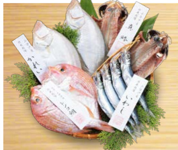
YS-69 (小伊津海旬房) 海旬房セット さざなみ 4,320円 (本体4,000円) (KSサザミ) 174653 送料込 冷凍便 真鯨約60g・エテカレイ約110g×各2、 レンコ鯛約110g・いわし 各1 賞味期限:冷凍で60日