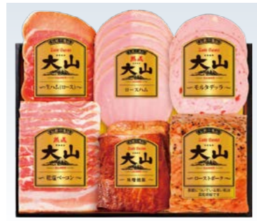
YS-14〈大山ハム〉 伝統の逸品 6種詰合せ 5,400円 (本体5,000円) (OR-35) 174327 冷蔵便 熟成乾塩ベーコン80g・味噌焼豚200g・ロースポーク 350g・生ハム(ロース)40g・モルタデッラ56g・熟成 ロースハム80g 各1 賞味期限:冷蔵で30日