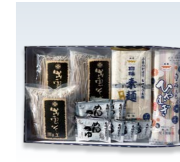
YS-77 (児玉製麺) 夏の彩り 3,564円 (本体3,300円) (GY-3R) 174173 出雲半なまそば200g×3、寒造り素麺300g×2、 白梅三色ひやむぎ270g×2、 光枝はあちゃんのめんつゆ (濃縮) 35g×6