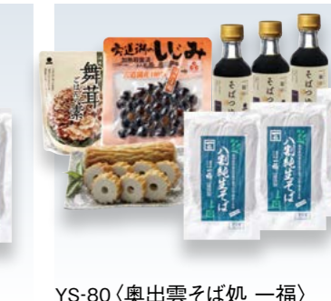
YS-80 (奥出雲そば処 一福) 奥出雲八割ふるさと詰合せ 5,500円 (本体5,092円) (IF-フル特) 174238 冷凍便 八割純なまそば240g×3、そばつゆ150ml×3、 あご野焼×1本、宍道湖のしじみ100g×1、 舞茸ご飯の素 (米3合分) 200g×1 ※7月1日からのお届け 賞味期限:冷蔵で30日