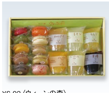
YS-92 <ウィーンの森> ジュレ・マカロンの詰合せ 4,600円 (本体4,259円) (UM-JM) 174084 <ジュレ>りんご・ラフランス・巨峰・レモン・ホワイトピーチ・パレンシア 各1、<マカロン>各種計10 賞味期限:常温で7日