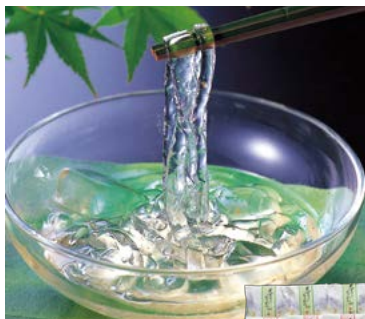
YS-97 <桂月堂> くずきりそうめん9個入 3,003円 (本体2,780円) (KK-9) 174378 くずきりそうめん(黒糖・梅・抹茶)各3 賞味期限:常温で30日