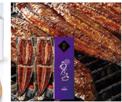
YS-60 (うなぎ処山美世) うなぎ蒲焼2尾詰合せ 10,401円 (本体9,630円) 174793 冷凍便 うなぎ蒲焼 (真空・半身) 100g×4、秘伝のタレ40g×2 賞味期限:冷蔵で21日