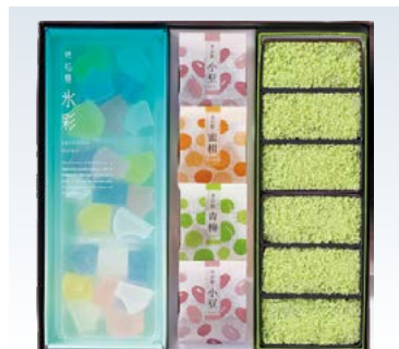
YS-95 <彩雲堂> 若楓 3,586円 (本体3,320円) 174289 若草6入×1、水の彩(小豆×2、蜜柑・青梅 各1)、 水彩×1 賞味期限:常温で15日