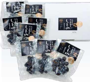
YS-57 (平野缶詰) 宍道湖産大和しじみ特大粒 4,860円 (本体4,500円) (HK-45) 174955 送料込 宍道湖産レトルトしじみ特大粒大100g×8