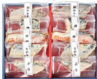
YS-3 〈山陰大松〉 水温熟成 味わい西京漬けギフト10切 5,400円 (本体5,000円) 〈SSK-10ST〉 174530 冷凍便

鯖西京漬け70g・銀鮭西京漬け60g・ 銀ひらす西京漬け60g・さば西京漬け60g 各2 賞味期限:冷凍で60日