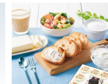
YS-82 (大山乳業) 白バラ乳製品ギフト 4,000円 (本体3,703円) (シハラニョク) 174963 送料込 冷凍便 生クリームヨーグルト75g×8、大山バター150g×1、 クリームチーズ180g×1 賞味期限:冷蔵で19日