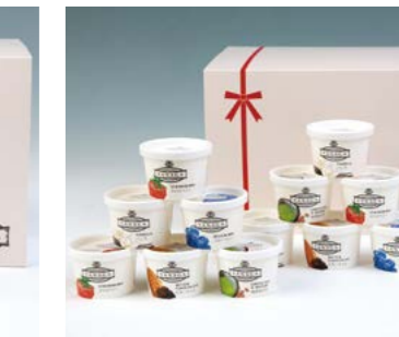
YS-88 (木次乳業) VANAGAアイス12個セット 6,912円 (本体6,400円) 174815 送料込 冷凍便 VANAGAアイス (バニラ・ストロベリー) 各120ml×各3、 (抹茶あずき・ビターチョコ・ブルーベリー) 各120ml×各2