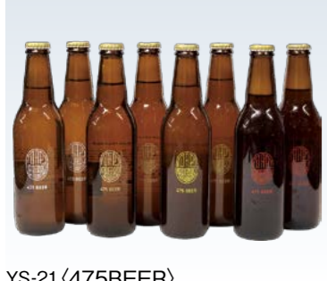
YS-21〈475BEER〉 475BEER飲み比べ8本 5,610円 (本体5,100円) (YB-8KK) 174408 冷蔵便 アメリカンペールエール・ピルスナー、コーヒーポーター・ レモネードベルジャンホワイト各330ml×2