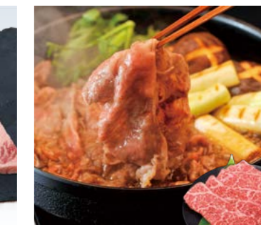
YS-28〈さんれいフーズ〉 しまね和牛モモすき焼き用 4,860円 (本体4,500円) (SF-004) 174254 送料込 冷凍便 300g×1 賞味期限:冷凍で180日