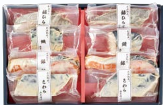
YS-2 〈山陰大松〉 水温熟成 味わい西京漬けギフト8切 4,320円 (本体4,000円) 〈SSK-8ST〉 174556 冷凍便

鯖西京漬け70g・銀鮭西京漬け60g×1、 銀ひらす西京漬け60g×2、さば西京漬け60g×2 賞味期限:冷凍で60日