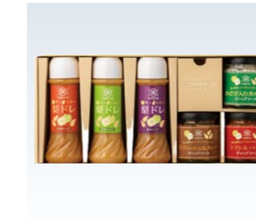
YS-29〈田畑商店〉 梨とらっきょうで作った ドレッシング&ディップソース 4,860円 (本体4,500円) (TBS-35) 174777 梨ドレ250ml×3、 ディップソース150g・160g・165g 各1