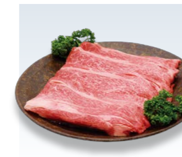
YS-25〈新日本食品〉 しまね和牛肩ロースすき焼き用 5,400円 (本体5,000円) (SN-50) 174432 送料込 冷凍便 300g 賞味期限:冷凍で30日