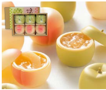
YS-90 <寿製菓> 二十世紀梨と 白桃のゼリー詰合せ6個入 5,001円 (本体4,630円) (NM-6) 174033 二十世紀梨ゼリー感動です。×3、白桃デザート×3