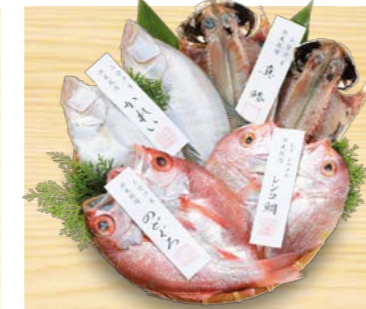
YS-71 (小伊津海旬房) 海旬房セット みなも 5,940円 (本体5,500円) (KSミナモ) 174670 送料込 冷凍便 真鯨約60g・エテカレイ約110g×各2、レンコ鯛約110g、 のどぐろ約130g各1 賞味期限:冷凍で60日