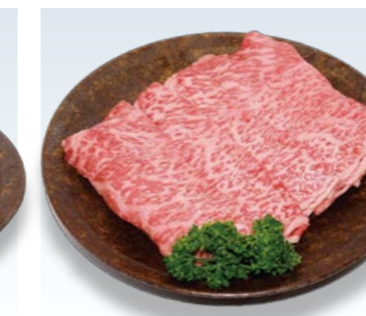
YS-26〈新日本食品〉 しまね和牛ロースすき焼き用 7,560円 (本体7,000円) (SN-70) 174440 送料込 冷凍便 300g 賞味期限:冷凍で30日