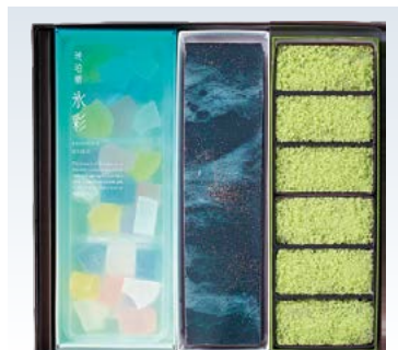
YS-96 <彩雲堂> 星月夜 4,450円 (本体4,120円) 174270 若草6入・満天・水彩各1 賞味期限:常温で15日