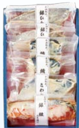
YS-1 〈山陰大松〉 水温熟成 味わい西京漬けギフト6切 3,240円 (本体3,000円) 〈SSK-6ST〉 174521 冷凍便

■6月5日(金)→8月5日(水) ■4階 ばらのギフトセンター 各日午後6時30分閉場 ※最終日は午後6時閉場 ■ギフトサロン松江 各日午後5時までの受付 (毎週水曜日は定休日)