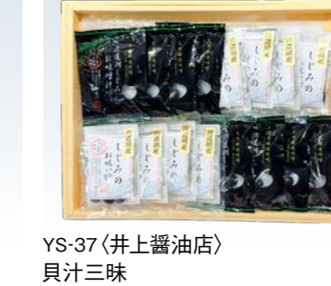
YS-37〈井上醤油店〉 貝汁三昧 3,867円 (本体3,580円) (KZ-35) 174483 穴道湖しじみ味噌汁37g×8、 穴道湖しじみ吸い物35g×8