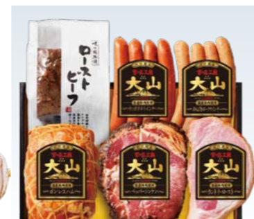
YS-12〈大山ハム〉 ローストビーフと食の匠工房5種詰合せ 10,800円 (本体10,000円) (DLG-114) 174351 冷蔵便 ローストビーフ200g・ペッパーシンケン300g・カントリー ロースト300g・ボンレスハム360g・辛口ポチキウイン ナー120g・あらびきポークウインナー120g 各1 賞味期限:冷蔵で30日