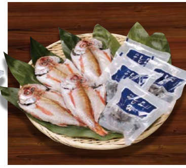
YS-62 (中浦食品) 鶴鶴屋 一夜干としじみ詰合せB 5,616円 (本体5,200円) (L1-14) 174130 冷凍便 のどぐろ4枚、宍道湖産冷凍大和しじみ60g×4 賞味期限:冷凍で30日