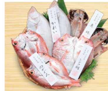
YS-70 (小伊津海旬房) 海旬房セット 海幸 5,400円 (本体5,000円) (KSカコウ) 174661 送料込 冷凍便 真鯨約60g・エテカレイ約100g・のどぐろ約60g 各2、 レンコ鯛約120g×1 賞味期限:冷凍で60日