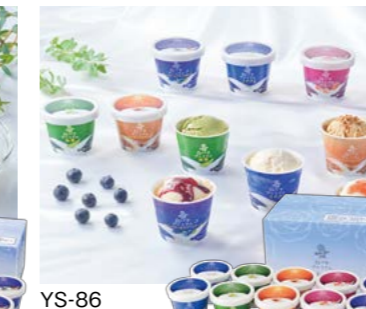
YS-86 (大山乳業) 白バラプレミアムアイスギフト10個 5,800円 (本体5,370円) (シハラプレミアム7A10) 174580 送料込 冷凍便 白バラプレミアムアイス (ミルク・抹茶・キャラメル&ナッツ) 各110ml×各2、 いちご・ブルーベリー&クリームチーズ) 各95ml×各2