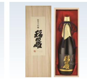
YS-74 (稲田姫) 純米大吟醸稲田姫30原酒 6,600円 (本体6,000円) 174220 純米大吟醸稲田姫30原酒 720ml×1