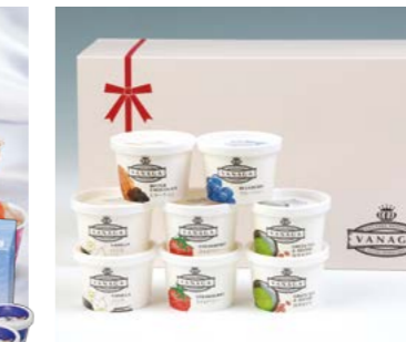
YS-87 (木次乳業) VANAGAアイス8個セット 5,130円 (本体4,750円) 174807 送料込 冷凍便 VANAGAアイス (バニラ・ストロベリー・抹茶あずき) 各1 20ml×各2、(ビターチョコ・ブルーベリー) 各120ml×1