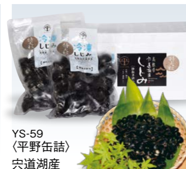
YS-59 (平野缶詰) 宍道湖産 冷凍 大和しじみ特大粒 5,000円 (本体4,629円) (HK-50) 174866 送料込 冷凍便 宍道湖産冷凍大和しじみ特大粒500g×2 賞味期限:冷凍で180日