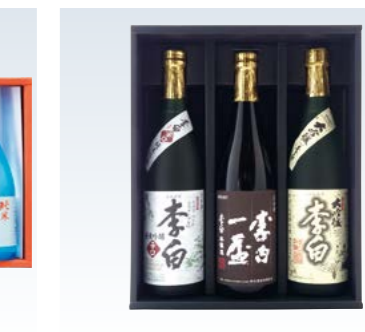
YS-76 (李白) 仙歌セット 6,001円 (本体5,455円) (R-11) 174424 大吟醸・純米吟醸辛口・本醸造李白一盃 各720ml ×各1