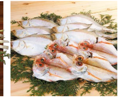
YS-64 (中浦食品) 鶴鶴屋のどぐろ・かれい一夜干 7,560円 (本体7,000円) (L1-5) 174106 冷凍便 えてカレイ6枚、のどぐろ開き4枚 賞味期限:冷凍で30日