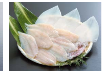
YS-68 (和田珍味) ふぐ・白いか一夜干 5,400円 (本体5,000円) (US50) 174645 冷凍便 ふぐ一夜干260g、白いか一夜干×3 賞味期限:冷凍で365日