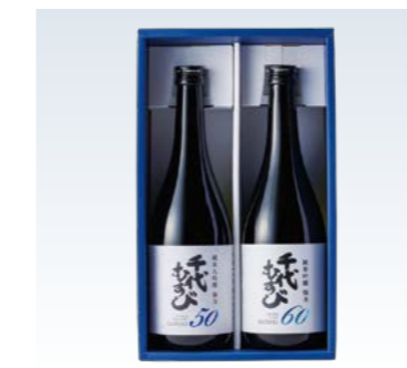
YS-73 (千代むすび酒造) 千代むすびGORIKIセット 4,620円 (本体4,200円) (CGS-S2) 174718 純米大吟醸 強力50・純米吟醸 強力60 各720ml×各1