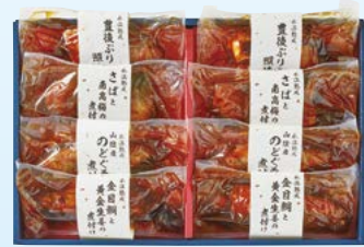
YS-8 〈山陰大松〉 水温熟成お魚惣菜ギフトセット(和の心)4種8切 6,480円 (本体6,000円) 〈OG-60ST〉 174947 冷凍便

金目鯛と黄金生姜の煮付け100g×2、さばと南高梅の 煮付け110g×2、豊後ぶりの照焼き90g×1、山陰産の どぐろ煮付け85g×1 賞味期限:冷凍で60日