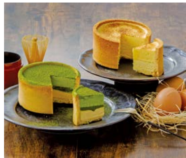
YS-91 <KAnoZA IZUMO> 抹茶フォンデュ・ フロマージュフォンデュセット 4,850円 (本体4,490円) 174491 冷凍便 抹茶フォンデュ・フロマージュフォンデュ 各1