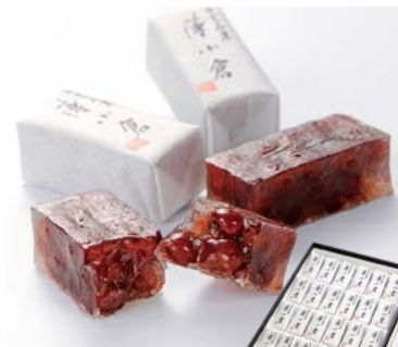
YS-98 <桂月堂> 薄小倉30個入 5,163円 (本体4,780円) (U-110) 174190 薄小倉×30 賞味期限:常温で14日